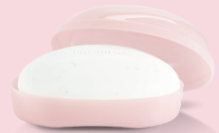
TimeWise® 3-in-1 Cleansing Bar (with soap dish)