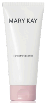
Mary Kay® Exfoliating Scrub

LA EXFOLIACIÓN ayuda a suavizar la textura de la piel y también puede ayudar a prevenir el desarrollo de piel reseca y escamosa. Además, este paso importante puede ayudar a mejorar el resplandor, la textura y claridad de la piel. También ayuda a reducir la apariencia de líneas finas y arrugas.