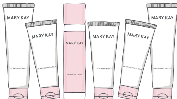
Línea Mary Kay® Skin Care