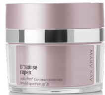
TimeWise Repair® Volu-Firm® Day Cream Sunscreen Broad Spectrum SPF 30*