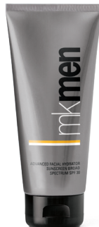
MKMen® Advanced Facial Hydrator Sunscreen Broad Spectrum SPF 30*