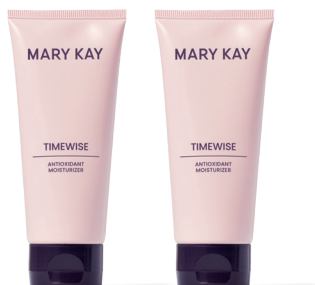
TimeWise® Antioxidant Moisturizer (Normal/Reseca y Combinada/Grasa)