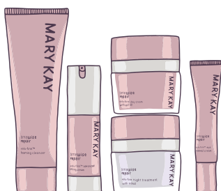
TimeWise Repair® Volu-Firm® Set