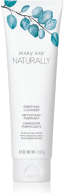
Mary Kay Naturally® Purifying Cleanser