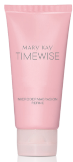
TimeWise® Microdermabrasion Refine