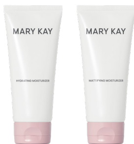
Mary Kay® Skin Care (Normal/Reseca y Combinada/Grasa)