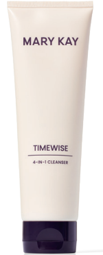
TimeWise® 4-in-1 Cleanser