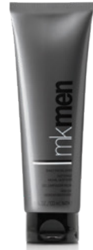
MKMen® Daily Facial Wash