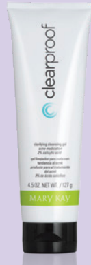
Clear Proof® Clarifying Cleansing Gel*