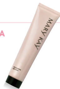
Mary Kay® Extra Emollient Night Cream