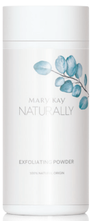
Mary Kay Naturally® Exfoliating Powder