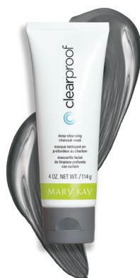
Clear Proof® Deep-Cleansing Charcoal Mask