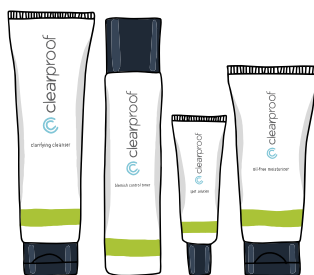
Clear Proof® Acne System

¿BUSCAS UN RÉGIMEN SENCILLO PARA EL DIARIO?