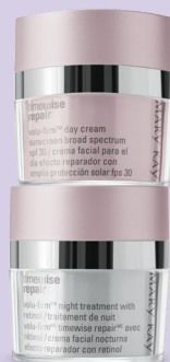
TimeWise Repair® Volu-Firm® Day Cream Sunscreen Broad Spectrum SPF 30*