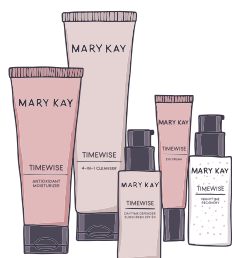
TimeWise® Miracle Set®