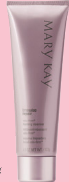
TimeWise Repair® Volu- Firm® Foaming Cleanser